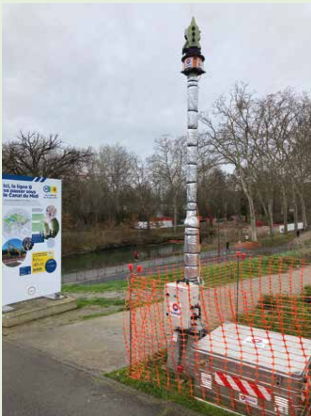
L'un des systèmes Cyclops déployés.

Éléments centraux du dispositif, plusieurs stations totales automatisées (solution Cyclops de Sixense Monitoring) ont été mises en œuvre afin d'assurer un suivi topographique automatisé et continu des avoisinants compris dans la zone d'influence géotechnique du tunnelier. Ce suivi en 3 dimensions (XYZ) a permis une surveillance continue des berges du canal du Midi, des culées de l'ouvrage de franchissement, des voiries alentour – notamment les avenues de l'Europe et Pierre-Georges-Latécoère – ainsi que des conduites GRT Gaz implantées à proximité du tracé. La précision de mesure submillimétrique, la fréquence horaire et la densité de points surveillés permettent d'analyser très finement les mouvements éventuels. ●●●