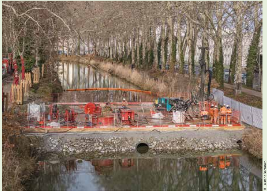
Travaux d'injections sous le canal du Midi.

L'ensemble des données issues de l'instrumentation a été centralisé sur la plateforme logicielle de monitoring de Sixense, Beyond Monitoring, utilisée comme véritable outil de pilotage technique du chantier. Elle a permis une visualisation en temps réel des mesures,